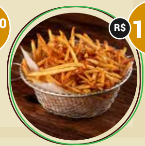
BATATA RÚSTICA COM ALECRIM